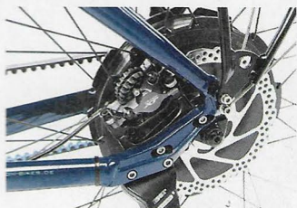
Lautlose Antriebspower: Albers Hecknabenmotor Neodrives Z20.