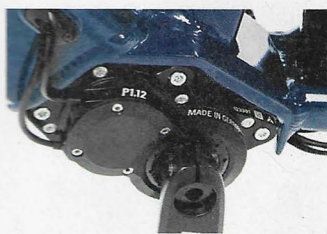
Starke 600% Gesamtübersetzung: Pinions Tretlagergetriebe P1.12.